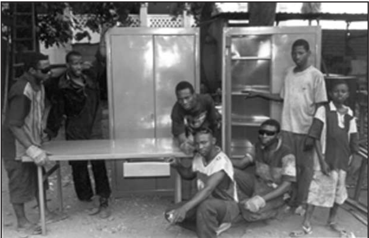
Atelier Carrefour des Jeunes (Bamako)