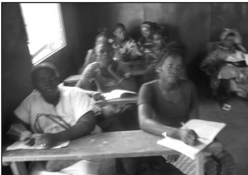
Session de formation en gestion simplifiée

du marketing et des techniques d'établissement de devis. Ceci a eu un impact très positif sur la qualité de la formation reçue par ces jeunes notamment dans la lecture des plans, les tracés, les différentes coupes, les établissements de devis.