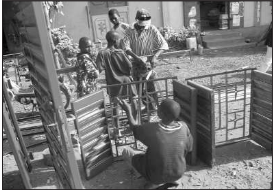
Jeunes en session de formation

photos, matériels de quincaillerie et divers) servant à confectionner des articles par les apprentis sous la supervision des formateurs. Avec ces matières premières, les apprentis sont mis en compétition pour pouvoir tester leur niveau d'apprentissage.