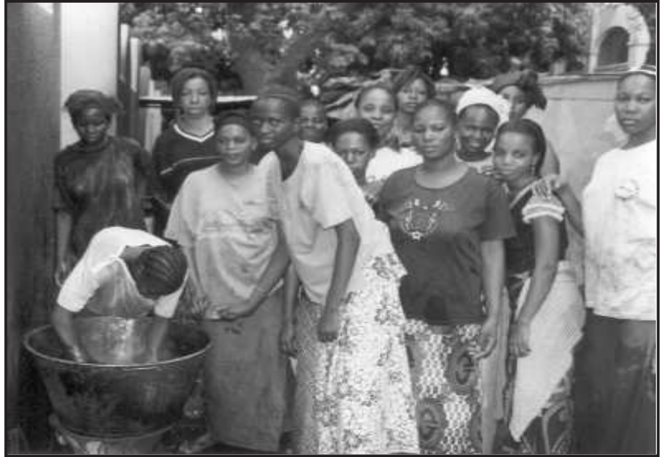
Filles en apprentissage

Sans se démarquer du développement rural, Enda, face aux graves contradictions créées par la ville, s'est engagée dans le traitement des problèmes urbains en général et particulièrement la situation des groupes