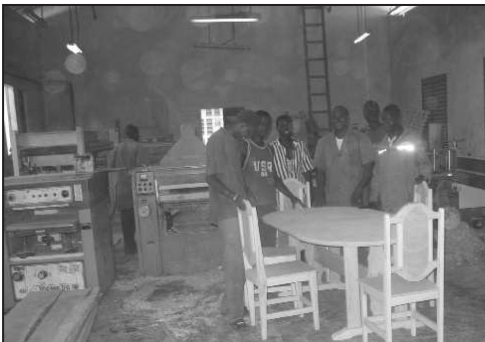
Atelier menuiserie bois

Les apprenants acquièrent des connaissances pratiques par rapport aux métiers choisis au niveau des ateliers d'accueil. En dépit de cette formation sur le tas et des sessions intensives de formation qui l'accompagnent, Enda