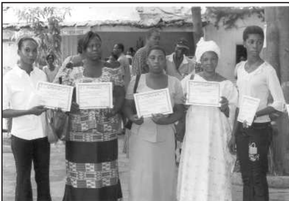
Filles en fin de formation

Enda. C'est la marque de confiance entre l'enfant et la structure.