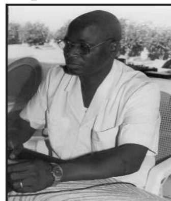
Coordinateur d'enda mali