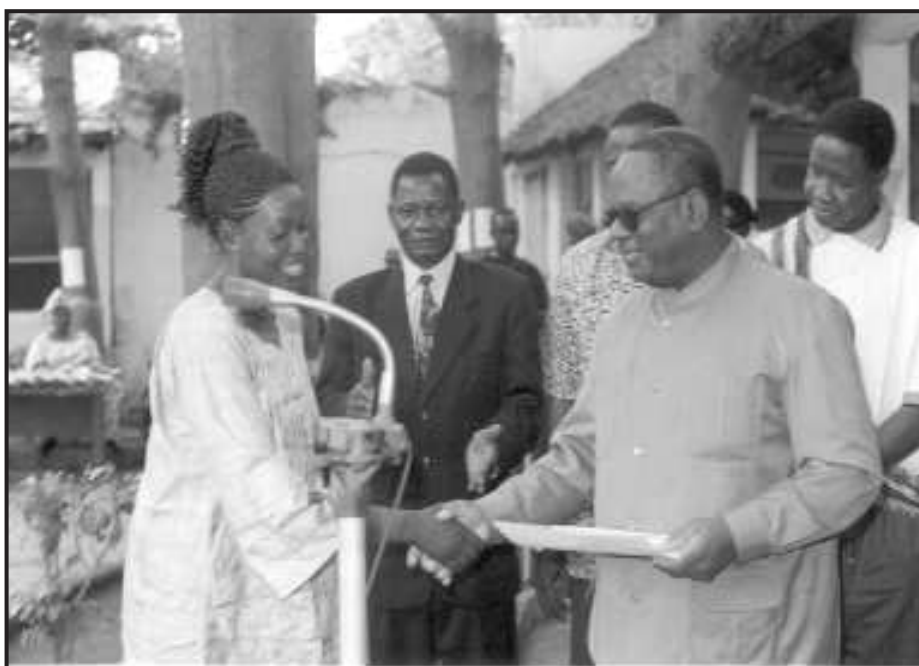
Le Président de l'Assemblée Nationale du Mali à la foire exposition des produits de jeunes en formation

Les réflexions doivent être conduites dans le sens de l'homologation des certificats délivrés, cela