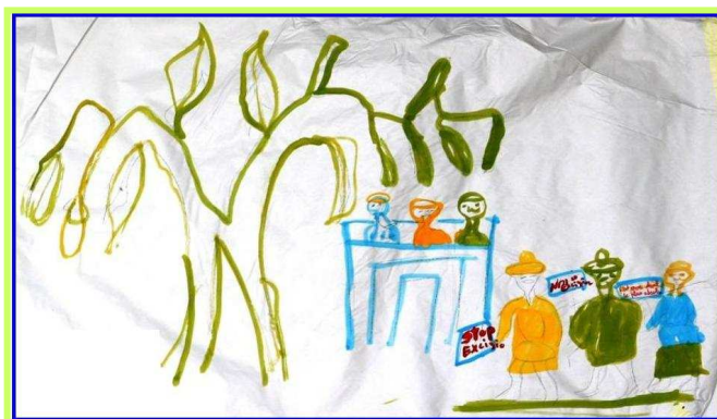
"Stop excision" - "C'est mon droit le plus absolu"

environnement et développement du Tiers-Monde