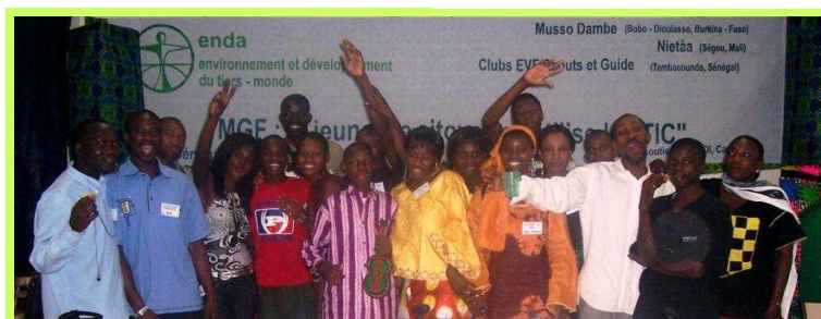
Mettre les jeunes au coeur du processus

A l'ère de la mondialisation, penser globalement l'excision, le genre, la citoyenneté, les jeunes et les TIC , c'est voir l'ensemble de l'enjeu de développement pour les communautés d'Afrique de demain, celle des jeunes d'aujourd'hui.