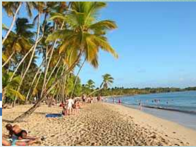
Plage des Salines